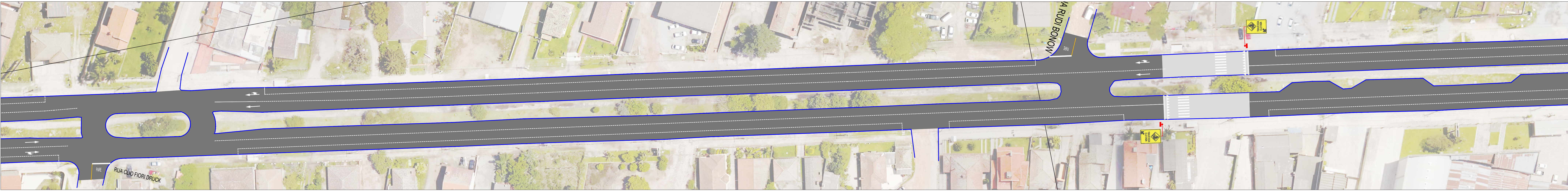
PLANTA BAIXA TRECHO FÉLIX CAPUTO - RUDI BONOW ESC. 1:1000