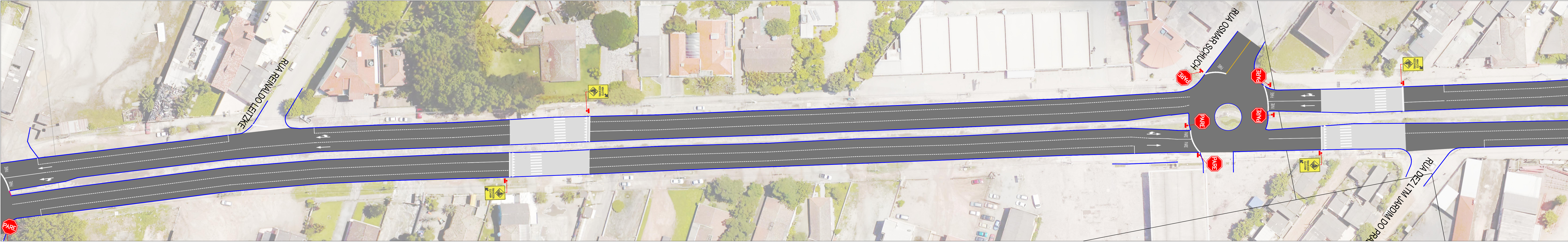
PLANTA BAIXA TRECHO ASSIS BRASIL - OSMAR SCHUCH ESC. 1:1000